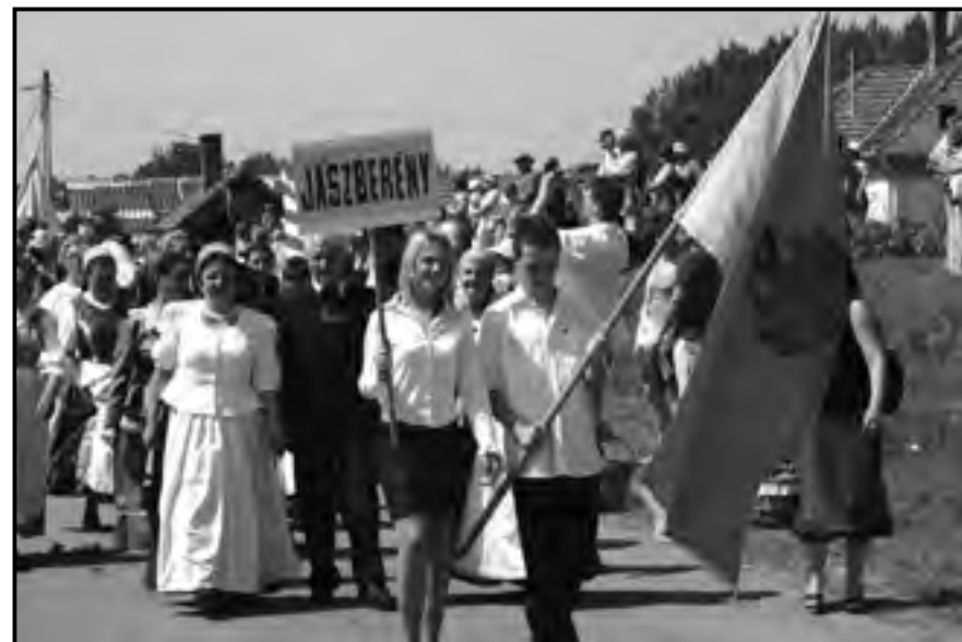
Felvonulás a XVI. Jász Világtalálkozón, Jászágó, 2010.

a süveget és a Jászkürt hiteles másolatát, amelynek öblébe ezüst poharat szorítva, s abba bort töltve a jászokra kell köszöntenie. A kapitány legfőbb feladata a jász hagyományörzés segítése, támogatása, a jász identitás erősítése. A kapitányi tisztség ugyan egy évre szól, de minden kapitány újra választható. Munkájukat a Jászkun Kapitányok Tanácsa irányításával végzik, amelynek élére háromévenként maguk közül jászkun főkapitányt választanak. A jász-, a nagykun- és kiskunkapitány megnevezés életük végéig megilleti őket.