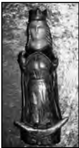
Holdsarlós Madonna festett faszobor