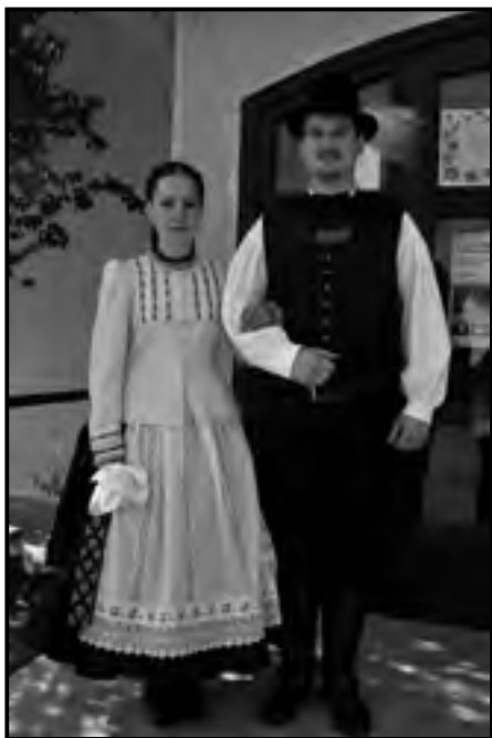
Fiatal pár jász viseletben

tót; nem voltak jobbágyok, mint a szomszédos népek) ma is felsorolja mindenki; nincsen olyan jázsági ember, aki Szolnokot el ne marasztalná vagy magát különbnek ne tekintené nem jázsági lakosú település lakójánál.