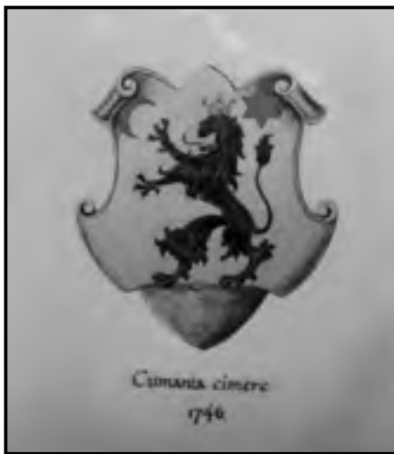
A Nagy-kunság címere a Redemptiót követő évben

nyilvánul meg. A Kunságban a korábban elkezdődött pusztásodás a török idők alatt fokozódott. A hódoltság, illetőleg a Rákóczi-szabadságharc utáni visszatelepülés, a Nagy-kunság benépesülése után alakult ki ez a sajátos történelmi tudat, ami a Jászkunságot, jászokat és kunokat egyaránt jellemezte, ami egyfelől származástudatot takar, de területhez kötődést is jelent. Ez az identitástudat tehát koronként más-más tartalommal töltődött meg, és akkor erősödött meg mindig, amikor a külső kör-