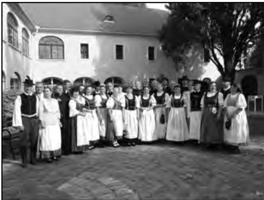
Jász viseletbe öltözött asszonyok és férfiak a Kiskun Múzeum udvarán, Kiskunfélegyháza, 2009.

tő nemcsak Magyarországon, de Európában is. Ahhoz azonban, hogy a jász viselet tovább éljen, nagyon fontos volt, hogy az elmúlt években létrejöttek a ruhákat készítő népi varróműhelyek és megteremtődtek viselésének alkalmai . Ilyenek a történelmi évfordulók, a város és falu napok, a jász bálók, a jász világtalálkozók, a különböző hagyományőrző rendezvények, de az is gyakorlattá kezd válni, hogy a lakodalmakban éjfélkor jász viseletbe öltözik át az ifjú pár, és abban mulatnak reggelig. De sokan készíttetnek és adnak ajándékba (például szülők, nagyszülők a távol élő gyermekeiknek, unokáiknak) főkötőt vagy teljes jász viseletet is.