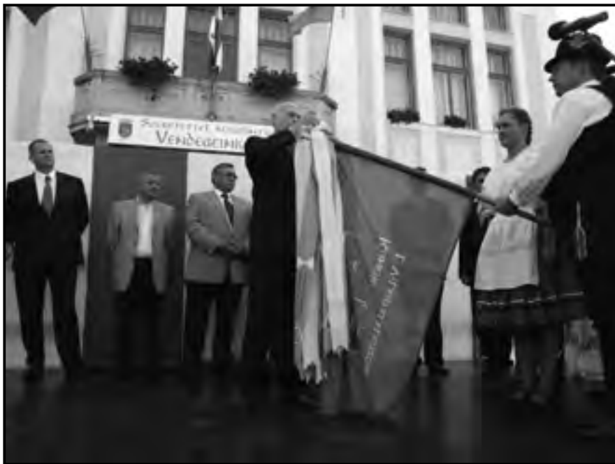
A II. Kun világtalálkozó zászlóbontása Karcagon, 2012. szeptember 8-án

rajzi nevek közül a Zádort , a Bengecseget , vagy a ragadványnevek között a Kecsét , ami az egykori kun névadási szokás egyikét idézi: alapja a gedzse: éjszaka született jelentésű szó.