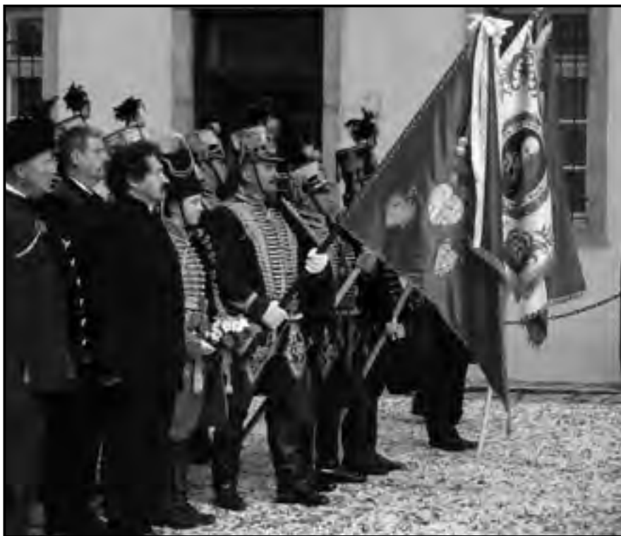
Jász- és kunkapitányok a Hadtörténeti Múzeum udvarán a jászkun huszárak emlékművének avatásán, Budapest, 2009.

Jász Múzeum igazgatója és Mészáros Márta, a Kiskun Múzeum igazgatója állított össze. 5