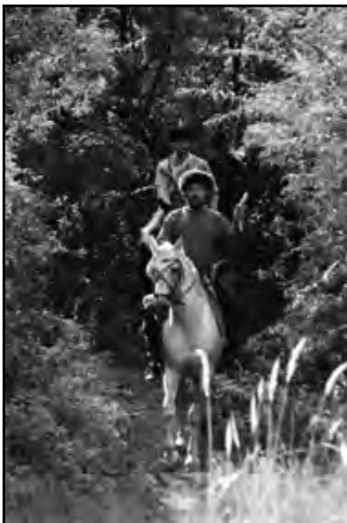
A Kisújszálláson évenként rendezett kunviadal az egykori lovashagyományokat idézi

2005 A XI. Jász Világtalálkozó krónikája. Jászberény