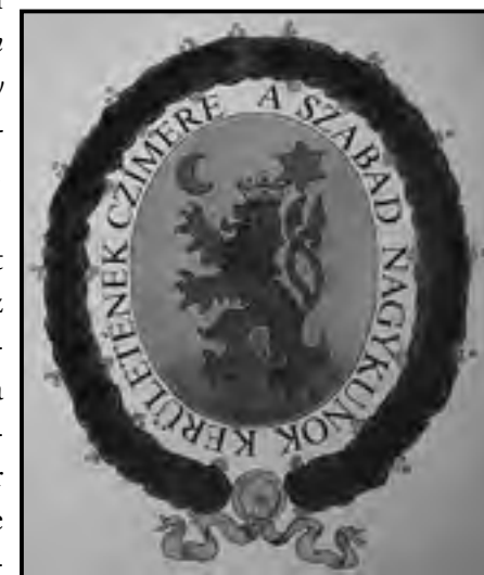
A Szabad Nagykunok Kerületének címere