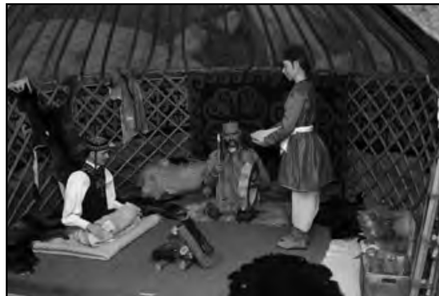
Részlet a szolnoki Damjanich János Múzeum Jáászunkapitányok nyomában című kiállításából