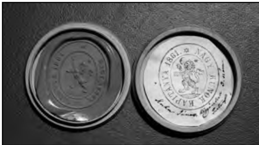
A Nagykunok Kapitányának pecsétje 1861-ből

adott, s egyben táplálta azt a sajátos történeti tudatot, ami a térség legfőbb jellemzője. Tanulmányomban azt igyekeztem bizonyítani, hogy nagykun identitás nem csupán a redempcióhoz kötődő emlék, hanem egyfajta etnikus specifikum is, a kun műveltségnek ha töredékesen is, de felismerhető emlékei is táplálják. A Nagykunok hagyományai erre épülve újratereprendőnek és új megnyilvánulási formát öltenek, ahogyan a társadalom kihívásai életre keltik azokat.