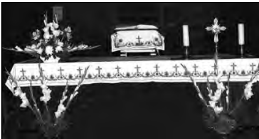
Jász mintával hímzett oltárterítő, Jászberény, (fotó: Bíró János)

megoldást, amellyel a régi mintákat napjaink textíliáin is alkalmazhatják. Már a munka elején egyértelművé vált, hogy hímzett subák zárt mintaegységei, a válltányérok és a sorminták nem használhatók fel az új alkalmazásban, ezért meg kell bontani őket, a motívumokkal (sasköröm, kutyatök, bödösbogaras, galambkosár, császárszakáll, vesevirág, gyorgyina, rozsmaringág, nyitott-csukott tulipánok stb.) új mintákat kell tervezni. 12 Így alakították ki a hímző asszonyok a régi szűcshímzésből azt a sajátos jász hímzést , amely már szervesen illeszkedik napjaink textíliáinak szerkezeti követelményeihez.