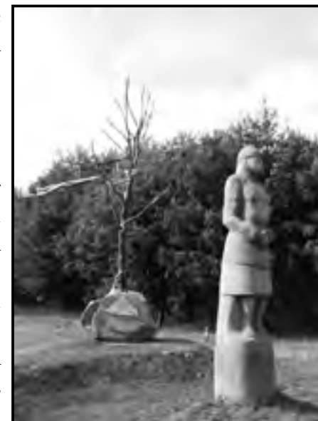
A kunok világfája, Kun emlékpark Kisújszálláson