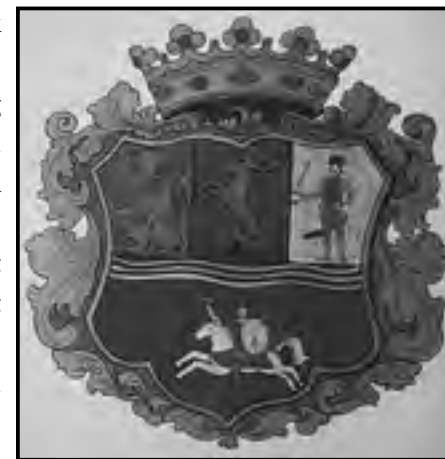
A Jászkun Kerület címere

Az állandó harcképes sereg fenntartása mellett egy összegben fizetett adók is terhelték őket. A jászok Szent György napkor 250, Szent Mihály napkor 250, Szent Jakab napkor 300 arany forintot fizettek. Ez utóbbit nevezték a jászok tegzes-pénzének. 27 Időközben egy-egy hatalmaskodó főúr, Heves megye vagy az egyház megkísérlti megrövidíteni kiváltságaikat, adófizetésre kényszeríteni őket, más juttatásokra szorítani, ám szívósan ellenállnak, s a király orvosolja sérelmeiket. Egy-egy oklevél hitelesítői között - ez egyben a biztosíték is - éppen ezért egyházi és világi méltóságok is ott találhatóak. 28