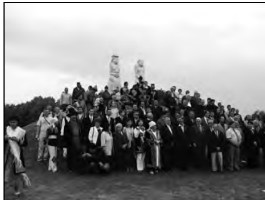
A Kun Összefogás Konzorcium tagjai az Ópusztaszeri Történelmi Emlékhelyen 2009-ben a Kunok I. Világtalálkozója alkalmából

viselet ázsiai eredete bizonyított. A kunságra annyiban jellemző, amennyiben a rajta lévő díszítés sajátossá tette. Ez a viseleti darab a legvitatottabb, hiszen a magyar nyelvterületen elterjedt, ám a különböző kelet- és nyugat-európai hatásokra alakult sajátosan magyar viselet lett, aminek álló gallérja, szabása, rátétes díszítése, archaikus, közép-ázsiai, de a díszítése olykor hódoltságkori török hatást is mutat.