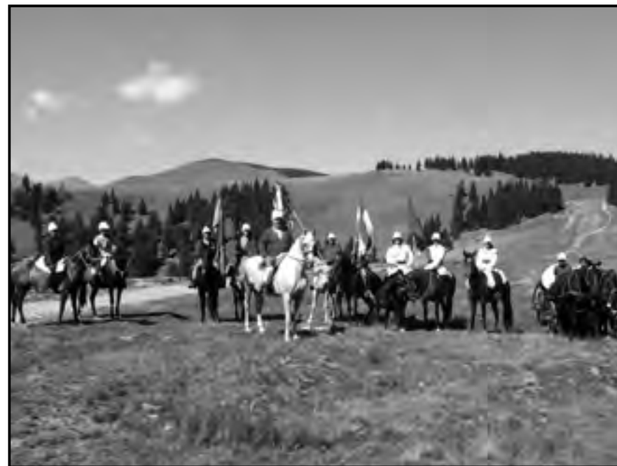
Lovas emlékmenet a Radnai –hágótól a karcagi Kun emlékhelyig 2009-ben, a kunok betelepülésének 770. évfordulója tiszteletére

De nézzük miként alakult a Kunság (csakis a Nagykuságot értem, mert a hódoltság utáni visszatelepüléskor ennek a vidéknek lakói egységesebbek voltak, többen ülték meg a régi településeket, mint a Kiskunság vidékén), tehát hogyan alakult e térség lakóinak története, hogyan maradtak meg azok az apró kulturális elemek, amelyek az egykori