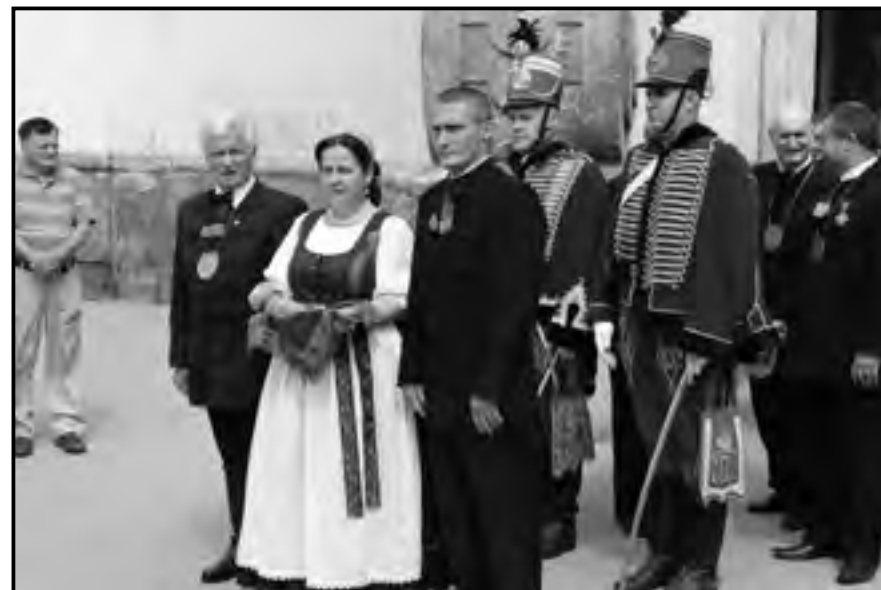
A Jászkürt ünnepélyes bevitele a jászberényi Nagytemplomba, 2013

szentmisére is beviszik, de másolatából iszik a jászkapitány is a tisztségébe való ünnepélyes beiktatásakor.