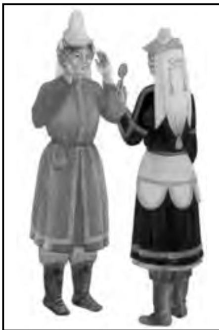
Rekonstruált kun női viselet

vések egyesítették az erőket egyben a határokat is kijelölték. Ez védelmet jelentett az itt élő lakosságnak. Feltételezzük, hogy a visszatelepült lakosság között arányaiban több lehetett a kun származású, a többi betelepült pedig alkalmazkodott a kultúrájukhoz. 11