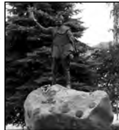
Jász-emlékmű, Jászberény, (fotó: Baráth Károly)

A jászok és a kunok a 20. században első alkalommal 1995-ben, egész éven át tartó, nagyszabású ünnepség keretében emlékeztek meg őseik példanélküli nagy tettéről, a Redemptio-ról. Ezt követően minden évben tartottak kisebb-nagyobb megemlékezéseket, s ebben Jászkóhalma járt jó példával, majd 2001-től Jászberényben a Városvédő Egyesület tagjai a Kapitánykertben emlékeztek meg a történelmi eseményről.