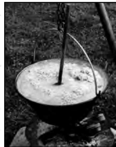
Húsos káposzta bográcsban, (fotó: Bathó Edit)

Nagy sikere van a minden év november 11-én, Márton napján,