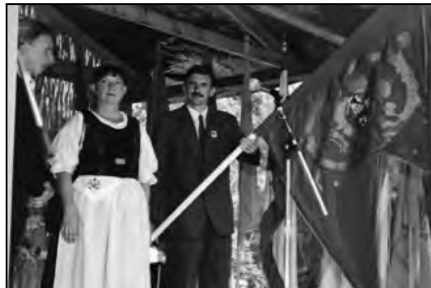
Rekonstruált redemptios zászló a Jász Világtalálkozón, Jászdózsa, 2001

A Jászkun Kerület 1876-os megszűnését követő időszakot Szabó László a történelmi és a kulturális tudat koraként jellemezte, amelyben már nem az egykori privilégiumok, hanem egyre inkább a történelmi és népi