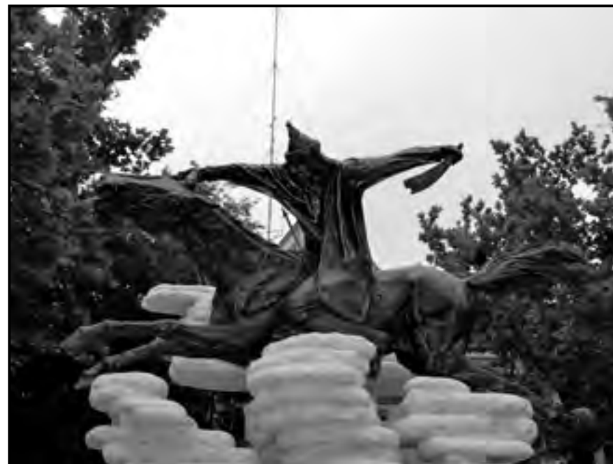
Lehel vezér szobra Jászberényben

rakeléseinkben. De erre utal az az időpont is, amikor az oklevél kelt: 1323. Ekkor már eldőlt ugyanis az oligarchák elleni harcok sorsa a király javára. A legutolsó ellenfelek is behódoltak. Csák Máté két éve halott, s ugyanekkor szenvedett Kun László is végső vereséget.