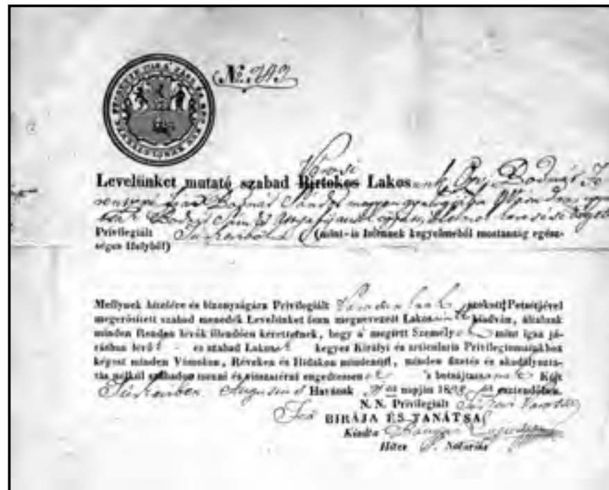
Túrkevéből való „útlevel”

a tájnyelv olykor jelentését veszítve is de megőrzött. A kun műveltség így a nyelv is a 16. századra fokozatosan belesimult a magyar műveltségbe. A nyelvtudomány a magyarországi kunok nyelvének problémáit Rásonyi László, Mándoky Kongur István és Baski Imre és munkásságával 13 jórészt összegezte, az újabb kutatási irány is kirajzolódott. Újabb nyelvészeti kutatások indultak a Nagykunságon, Vásáry István professzor és Molnár Ádám turkológus végez nyelvészeti gyűjtéseket, amelyek során elsősorban arra kíváncsiak, hogy a tájnyelv őriz-e még a kun nyelvemlékeket.