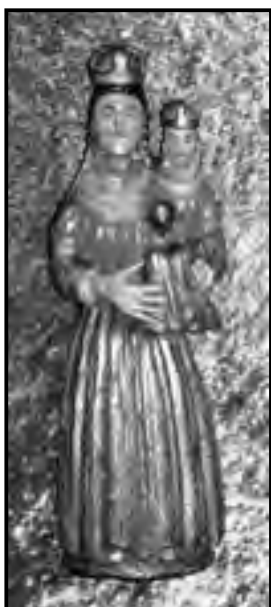
Kiskunsági Madonna festett faszobor

Máriának Mária Teréziával, a jász redempció létrehozójával való kapcsolatot is.” 78