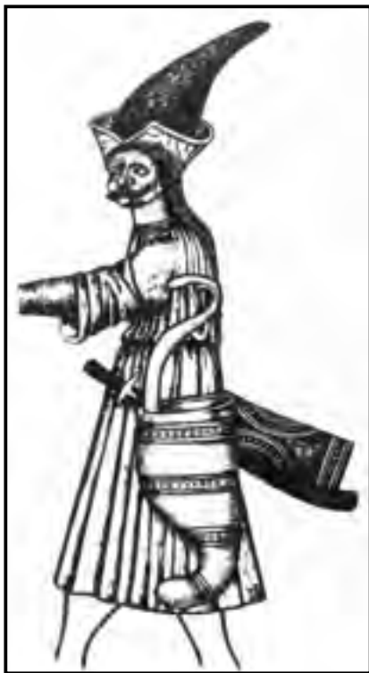
Kun harcos készenléti íjtartóval a székegyderzsi falfestményről (Pálóczi Horváth András 1989 nyomán)

tettek számukra akkor is, amikor kiváltságaikért már nem fegyvereik erejével, hanem adózással fizettek. 7 A katonáskodó kunoknak fegyveres szolgálataik háttérbe szorulásával megélhetésükhöz új forrásokat kellett teremteniük, s ez jelentős változásokat okozott az életmódjukban. A legeltetésen alapuló nagyállattartó gazdálkodásuk egyre szűkebb területekre korlátozódott. A kun szállásoknak a Duna–Tisza közén is igazodniuk kellett a szomszédos magyar falvakhoz. 1526-ban a Magyarországra bevonult, Budára tartó török hadak szinte elsőként a kun szállásokat dúlták fel. A megkezdődött 150 éves török uralom jelentősen hozzájárult a kun etnikum megfogyatkozásához és szétszóródásához.