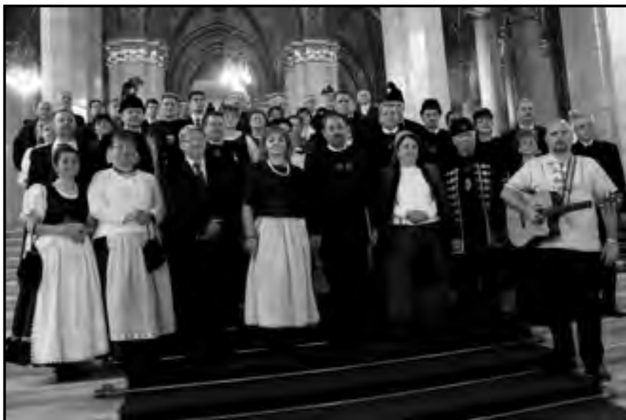
Jászok és kunok delegációja a Parlamentben a Jászkun Redemptio történelmi emléknappá nyilvánításának alkalmából, Budapest, 2014.

települések címerei valamint a szabad jászok bronz címere látható. Az emlékmű Györfi Sándor szobrászművész alkotása.