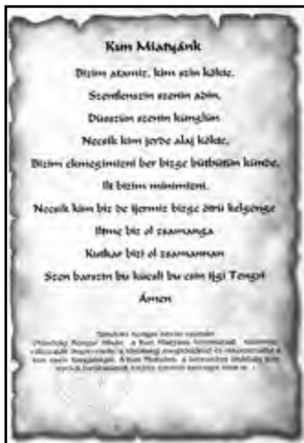
Kun Miatyánk – az Úr imádsága a rekonstruált kun nyelven

új megnyilvánulási formát öltött az identitás, a kunsághoz tartozás tudata. Az értelmiség, itt elsősorban a nagynevű gimnáziumaink Kisújszállás és Karcag tudós tanáraitra gondolunk, és a református papokra, akik ügyeltek arra, hogy a kun származástudat eleven maradjon. Még a két világháború között is a helyi Kertész nyomdában nyomtatott iskolai füzetek hátoldalán is rövid Kunság-történet volt olvasható, s a diplomáinkban ha torzult alakban is, de elhangzott a „kun miatyánk”. az Úr imádsága kun nyelven. 4 Jóllehet, a zsendülő tudományos érdeklődés első monumentális vállalkozása a 19. sz. végén (1870-1885) megjelent a