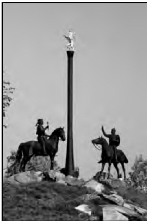
IV. Béla és Kötöny kán találkozása a Radnai-hágónál Emlékmű Karcagon (Györfi Sándor szobrászművész munkája)

történelmüket tagolták, s életüket újabb és újabb mederbe terelték. Az etnikai, nyelvi, regionális és vallási alapon képződött csoportok identitását mindenkor erősítette az idők során létrejött sajátos szubkultúrájuk, amely magába foglalja a közös történelmet, a beszédmódot, az étkezési kultúrát, a viseletet, a közös szimbólumok egységes értelmezését, a hagyományok ápolását. A nemzedékeken átívelő szubkulturális motívumok ébren tartják a népcsoport összetartozás tudatát, identitását, ösztönzik a kiskunságiak táji történeti vagy etnikai szempontból sajátos közösségeit a gyökerek megismerésére.