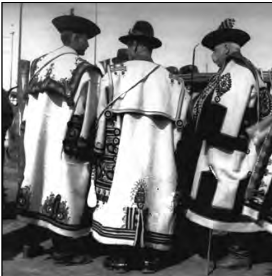
Kevi és ványai pásztorok a túrkevi vásárban 1930-ban