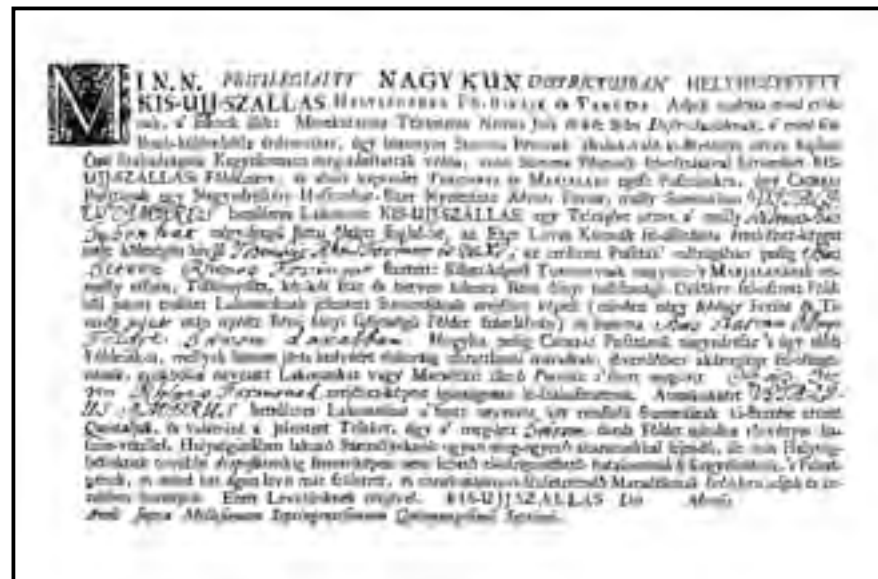
Kisújszállási redemptus levél

A Kunságot jellemző identitástudat különféle megnyilvánulási formákat öltött a történelem során. Alakváltozásai, többnyire attól függtek, hogy milyen volt a társadalmi környezet, ami életre hívta. Ez az erős történelmi (jogi) tudat a privilégiumok elnyerése után, de leginkább az 1745-ös visszaváltkozás, a redempció alkalmával jelent meg. Tartalma azt közvetíti e csoport tagjai felé, hogy mi vagyunk a kunok, akik külön csoportként, érdemeink alapján elnyertük azokat a kiváltságokat, amelyek meghatározták helyzetünket ebben a hazában. Ezeket a privilégiumokat védeni kellett, s ennek a védelemnek, az új kiváltságok szerzésének hagyományi lettek, történetük volt. Összekovácsolódott a Jászkunság népe, bár minden történelmi sorsforduló próbára tette, mégis mindig visszatért az elődöktől örökölt kultúrához, átmentve, megőrizve a szokásokat, alakítva azokat a kor szelleméhez. Mindez azért lehetett, mert a mai megyerendszer megalakulásáig meglehetősen zárt volt a társadalom, nehezen fogadott be idegeneket, s ha mégis arra kényszerült, alkalmazkodásra kényszerítette őket.