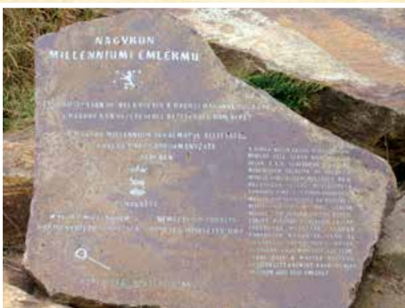
A karcagi Nagykun Milleniumi Emlékmű, és a tövében található márványtábla.