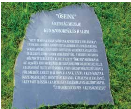
A szobrok, és a lábuknál lévő emléktábla.