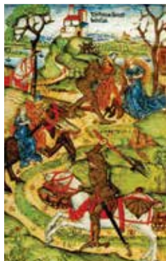
Szent László harca a kun vitézzel a Thuróczy-krónikában.