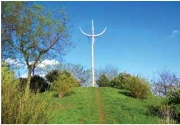
A Makovecz Imre emelte életfa az árpádalmi kunhalmon.

Az azonos nevű falutól keletre, a Justhmajor felé vezető úton található a település állítólagos névadójául szolgáló kunhalom. A tetején Makovecz Imre 1989-ben életfát állított, itt tartják a falu megemlékezéseit a nemzeti ünnepeken. A 2000-es évek közepén az életfát felgyújtották, az önkormányzat 2011. június 12-én újraállította.