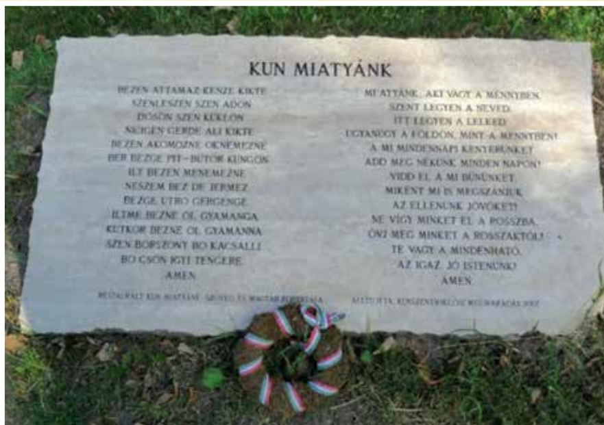
A kunszentmiklósi Kálvin tér márványtáblája a Kun Miatyánk szövegével.