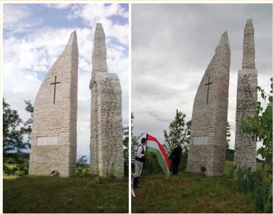
A kunok ellen vívott cserhalmi csata emlékműve Kerlés - Cegőtelke határában.

Az emlékművet néhai Csiha Kálmán erdélyi- és Tökés László akkori királyhágómelléki református püspök részvételével avatták fel. Cserhalom az erdélyi mezőség keleti peremén, az egykori Szolnok-Doboka vármegyében van, a történelmi Kerlés falu mellett, nem messze az egykori Beszterce vármegyei határtól, a ma is létező Cegőtelke falu határában. Minden év júniusában kerül sor Cegőtelkén a Lármafa-találkozóra, a Cserhalom Művelődési Egyesület szervezésében. Ekkor ünnepség keretében helyi fiatalok játsszák el a híres leányrablási és szabadítási jelenetet.