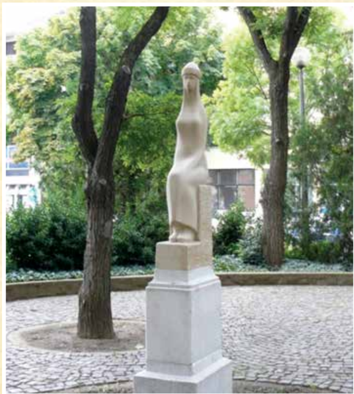
Papi Lajos: Kötöny király unokája című alkotása.

A város központjában, a Kálvin parkban látható nőalak Papi Lajos szobrász 1985-ös Kötöny király unokája című alkotása. A kőből készült, ülő Madonna mintegy másfél méter, talpazattal 2,3 méter magas. A későbbiekben a szobor vandalizmus áldozata lett. A helyreállítására 2008-ban került sor, amikor a Kisújszállási Városvédő – és Szépítő Egyesület megkereste Györfi Sándor szobrászművészt, aki vállalta, hogy anyagköltségért elkészíti a szobor teljes rekonstrukcióját Papi Lajos szobrászművész iránti tiszteletéből, hiszen ő maga is mentorának tekintette a neves szobrászt.