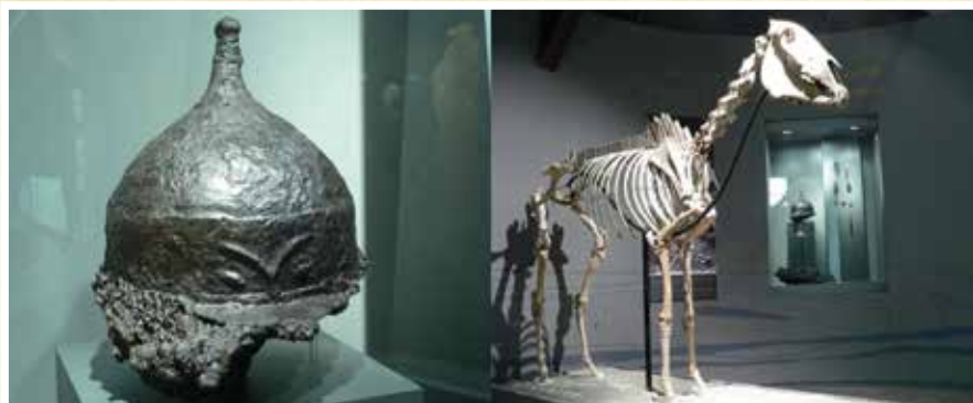
A csengelei kun vezér bronzsisakja, és vele eltemetett lovának csontváza. Kiállítva az Ópusztaszeri Nemzeti Történelmi Emlékparkban.