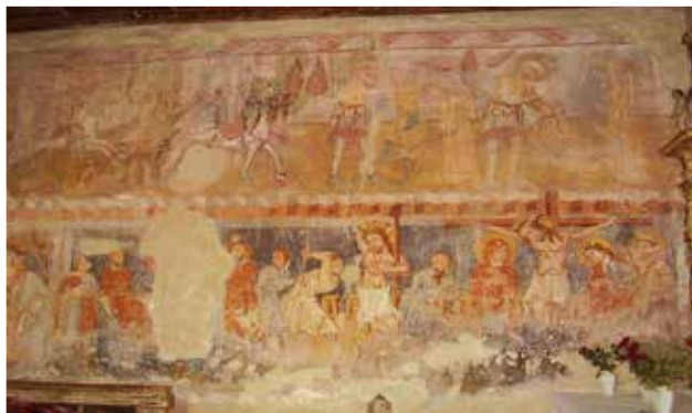
A szerző saját készítésű fényképe, a gelenczei templom XIV. századi falfreskóját ábrázolja a Szent László legendáról.