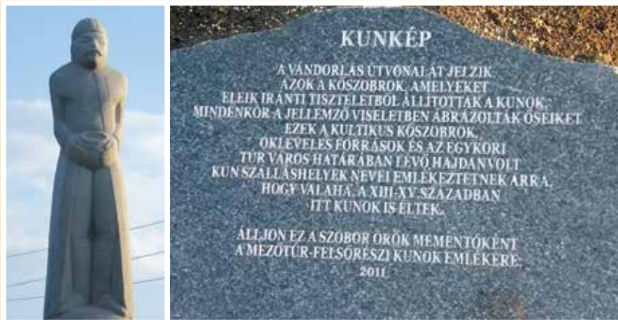
Mezőtúri kusbaba és táblája

A szobor sorozatgyártás, az első szoborcsoportot 1995-ben állították fel Karcagon, majd később több helyre kerültek az ottani szobrok után öntéséből.