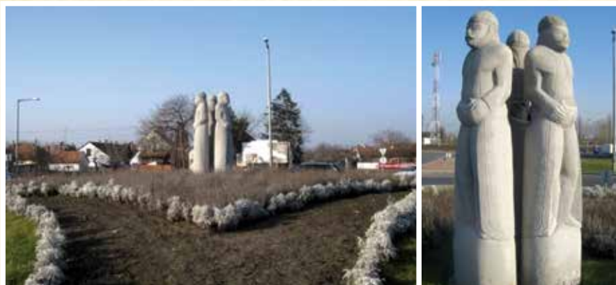
„Kun őseink emlékére” szoborcsoport, Kiskunhalas.