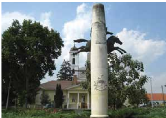
A kunhegyesi kun emlékmű, mely a közép-ázsiai lovasnomád népek sajtatos harcmódorát ábrázolja.