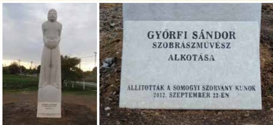
A kaposvári Kunkép.