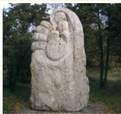
Kiskunhalasi Kun Madonna.

Az emlékmű Szalai József művész-tanár alkotása, melyet 2009 szeptemberében, az I. Kun Világtalálkozó keretein belül avattak fel. A Semmelweis Kórház mögött elterülő Csetényi parkban elhelyezett 13 tonnás szobor a múltnak, a kunok beilleszkedésének állít emléket, mely szerves része Kiskunhalas történelmének.