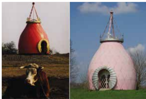
A Hód-tavi csata helyszínén felállított emlékmű átadás utáni, és jelenlegi állapota.

Az emlékmű Hódmezővásárhely külterületén, a motocross pályát körülvevő kerítésen belül található. Közeli megtekintésre csak a pálya nyitvatartási idejében van lehetőség, viszont az emlékműbe bemenni nem lehet. Az emlékmű belsejét egykor festmények díszítették, de vandalizmus áldozatai lettek, ezért lemeszelték őket. Az emlékmű piros, hagyma alakú kupolaszerű, jurtára emlékeztető építmény. A történelmi írások szerint a város területén zajlott a Hód-tavi csata 1282. augusztus 18-án. A tatárjárás után IV. Béla kunokat telepített a néptelen Alföldre, akik sok alkalommal győzelemhez segítették őt és utódait. A keresztény magyarságba történő beolvadásuk azonban egy hosszabb, konfliktusokkal teli folyamat eredménye volt. IV. Béla unokája, a kun anyától született IV. (Kun) László magyar főurak nyomására 1282-ben a Hód-tavi csatában legyőzte az ellene fellázadt, pogányként élő kun sereget (amiben segítette a csata közben megeredt eső, mely használhatatlanná tette a kunok íjait) és ezzel megszilárdította hatalmát.