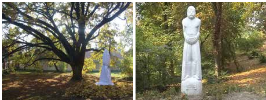
A kunbaba festői helyszíne a leleplezés előtt (bal oldali kép), és a leleplezés után (jobb oldali kép).

Bácskossuthfalva újratelepülésének 225. és a református közösség megalakulásának 225. évfordulója alkalmából állítottak kunbabát 2011. november 4-én a református templom udvarán. A szobor Györfi Sándor Munkácsy- és Mednyánszky-díjas karcagi szobrászművész alkotása.