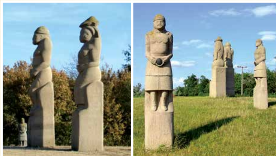
Balról látható a két főalak, jobbról pedig az őket körülvevő mellékalakok, melyek az őket állító település felé tekintenek.