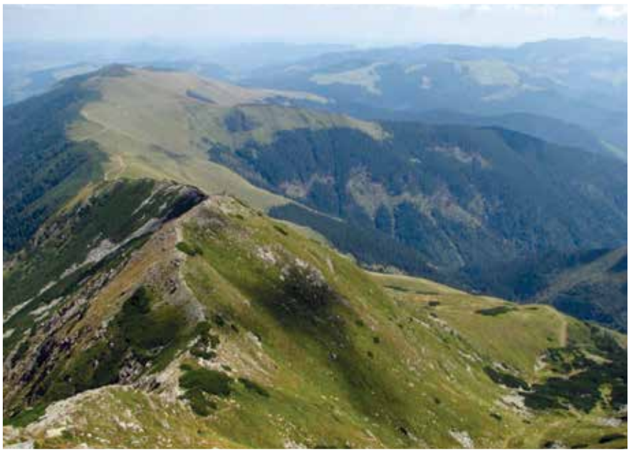
A Radnai-havasok két emblemikus csúcsa, a Lála és a Gaja gerincvonala, háttérben a Radnai hágó, a Kárpát-medencébe érkező kunok legendás útvonala.