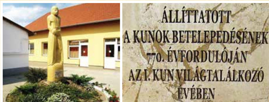
A kunhegyesi kunbaba.

A Református Általános Iskola udvarán álló műkő szobor Györfi Sándor Munkácsy- és Mednyánszky-díjas karcagi szobrászművész alkotása. Az ősök szellemét idéző, s a mai kun leszármazottakat vigyázó kőszobor nem egyszerű sírkő, mert nem az elhunytak csontjai felett áll. Az ábrázolt férfi alak összekulcsolt kezében csésze található, amelyből valamikor kumiszt ittak a törzsfők áldomásként az egyezségre, az összefogásra.