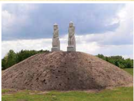
A korábbi (bal oldali kép), és a jelenlegi helyén lévő szoborpár (jobb oldali kép).