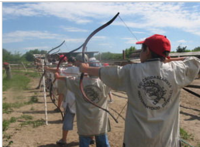
A képek egy korábbi táborban készültek