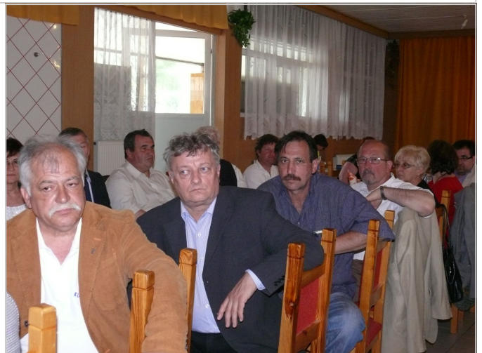
Képek a közgyűlésről