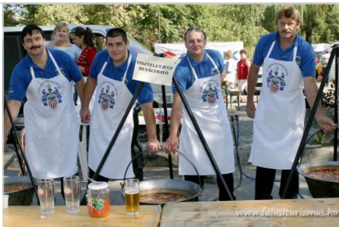
A karcagi és a kunszentmiklósi főző csapat